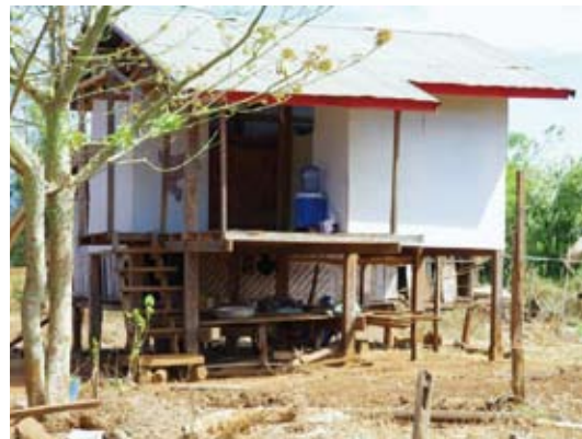
Auf der „Terrasse“ dieses Hauses auf dem Land entdeckten wir einen unserer Wasserfilter!